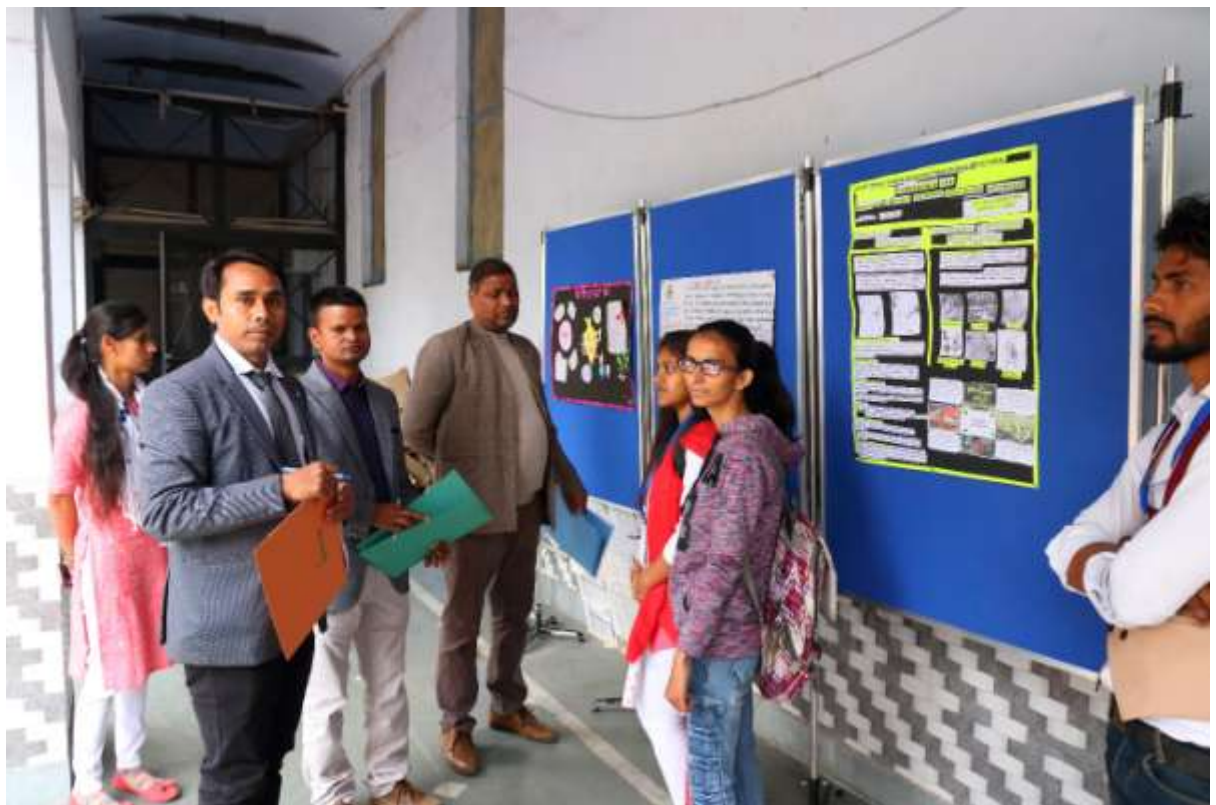
11. Poster presentation Competition and Judges interacting with participants.