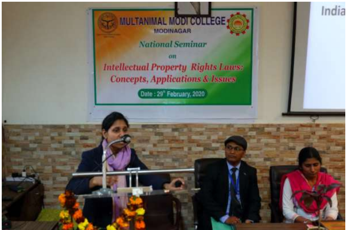
10. Oral Presentation by Participant