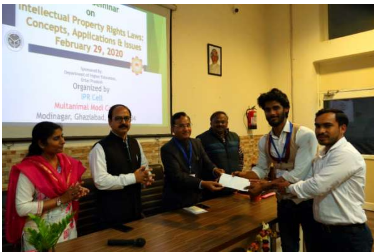
13. Cash prize distribution by Principal along with resources persons to First prize winner