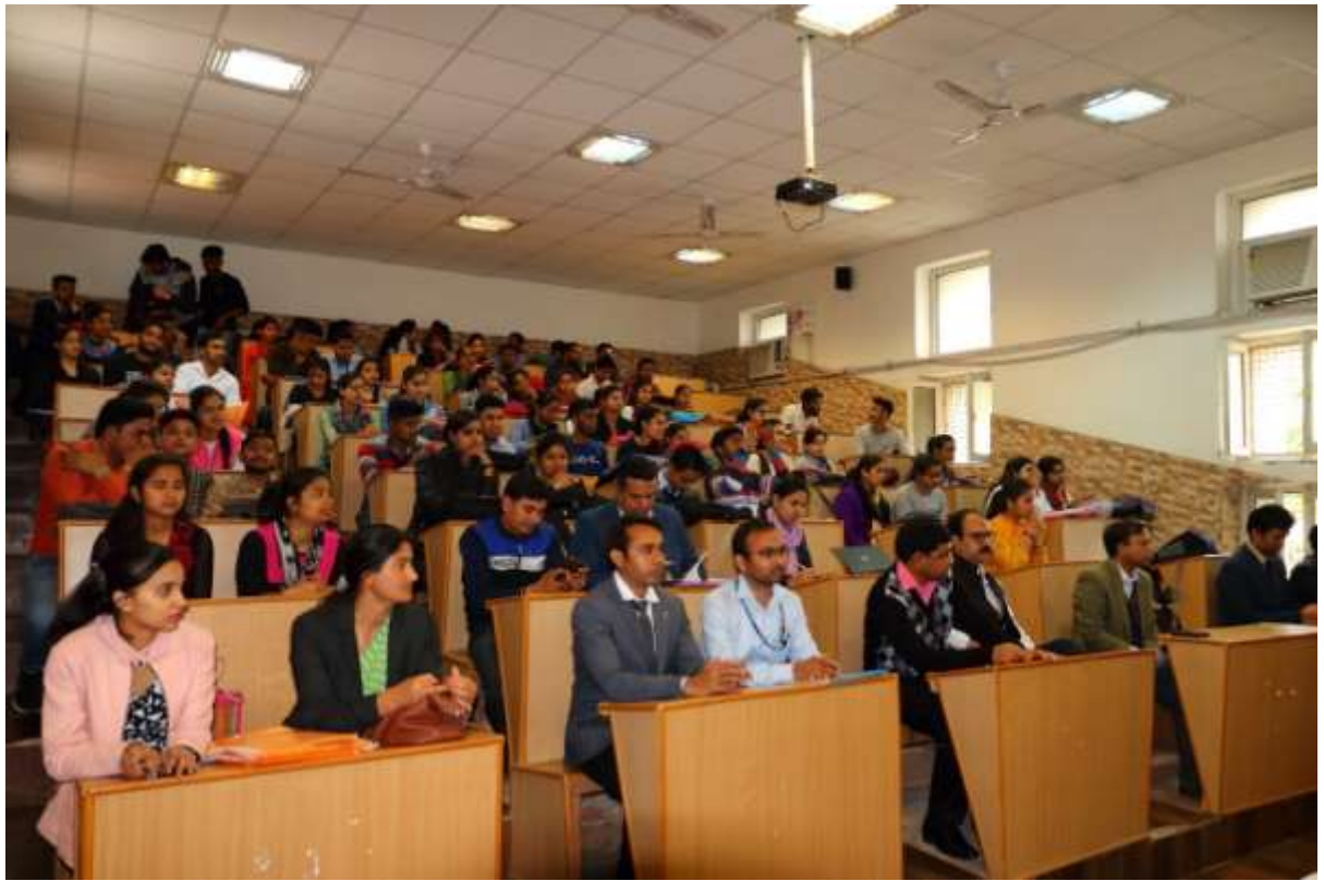
2. Participants of the seminar sitting in Seminar Hall of the College.