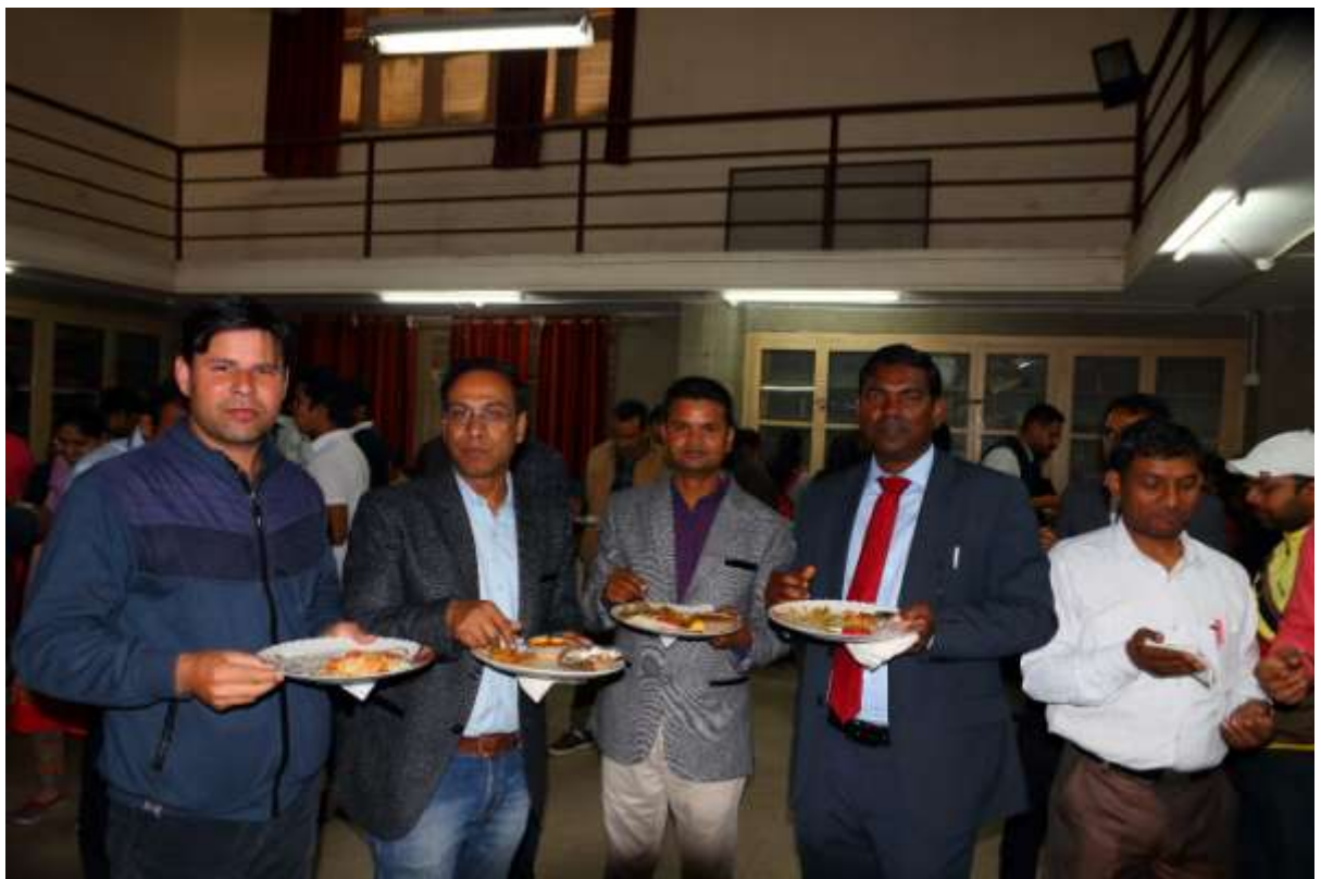
9. Lunch in Committee Hall of the College