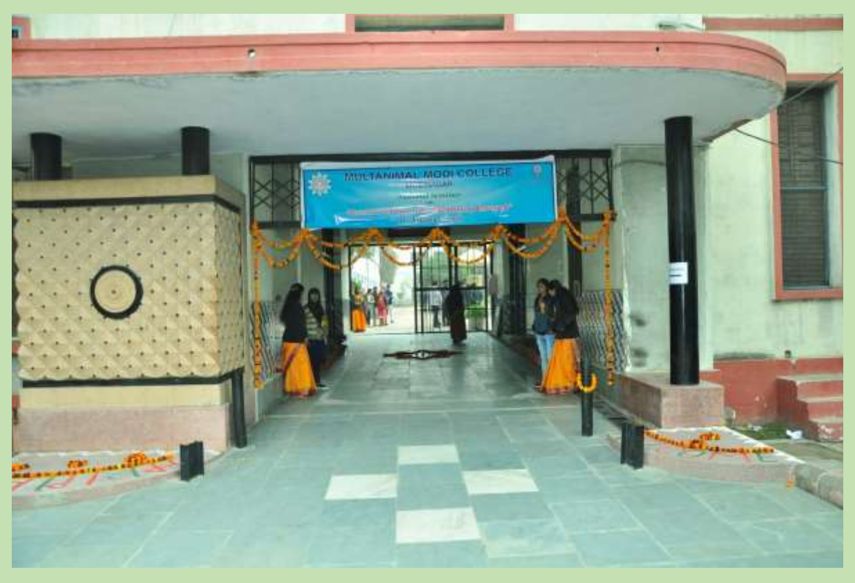
1. Welcome of Participants in National Seminar