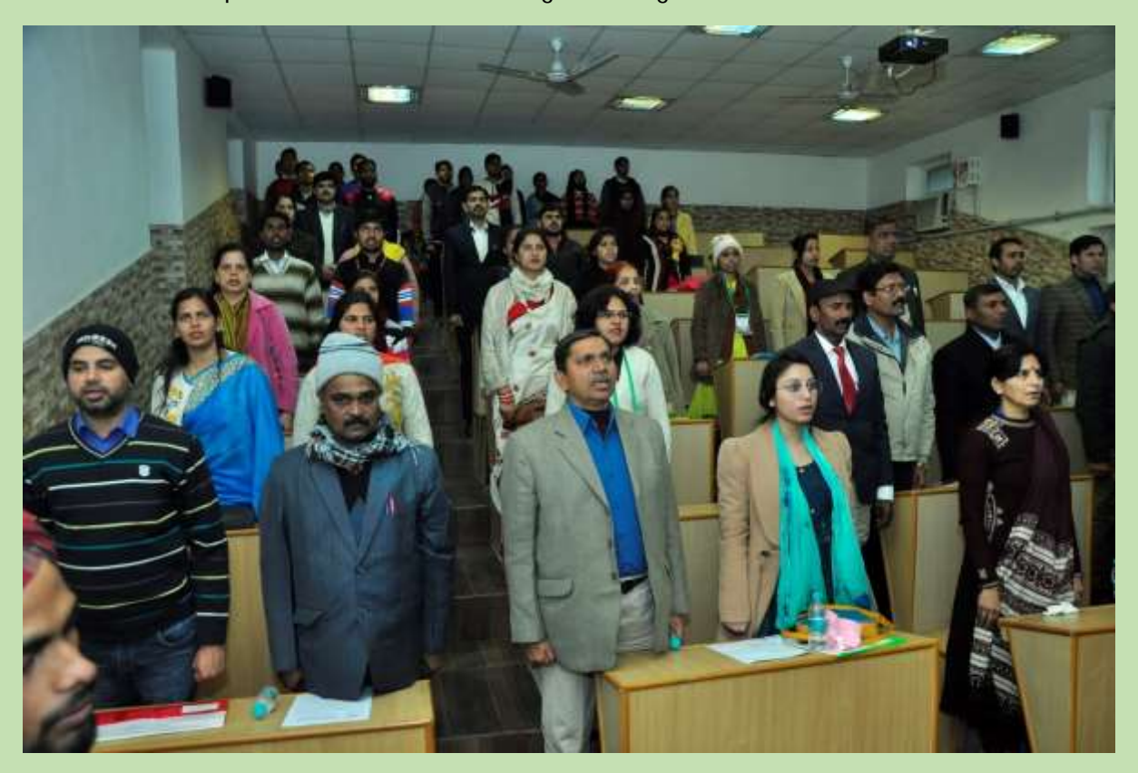
24. National Anthem was played after valedictory session