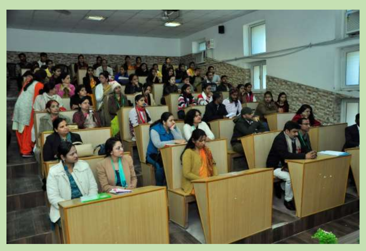
15. Technical Session in Seminar Hall