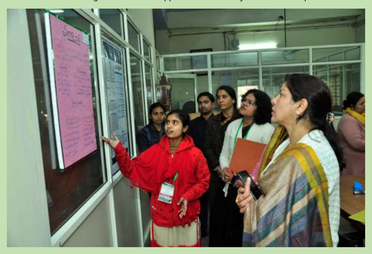
20. Poster presentation by participants