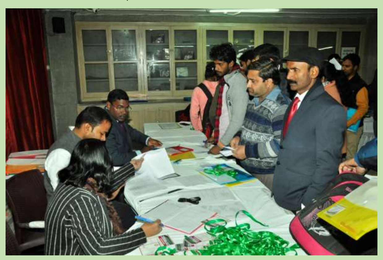
2. Registration Desk for National Seminar